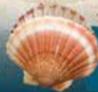
Coquilles St Jacques

Le Port du Collet - 44760 Les Moutiers en Retz www.restaurant-lamaisondeleclusier.fr