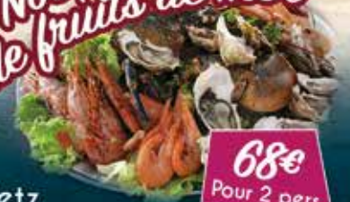
68€ Pour 2 pers.