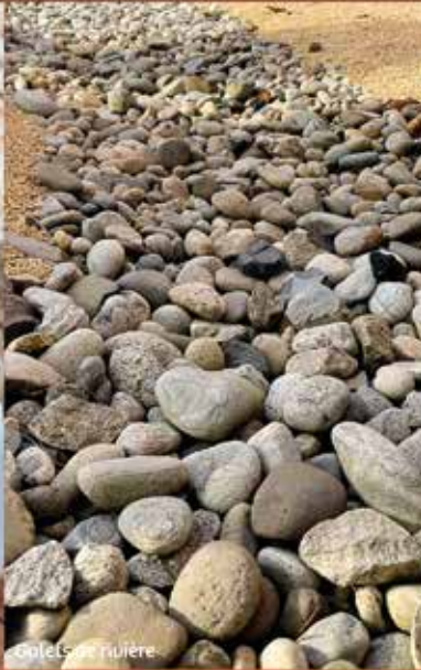
Cailloux de rivière