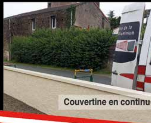
Couvertine en continu

ALU GOUTTI 85 85190 Maché www.alugoutti.fr