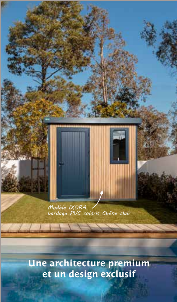
Modèle IXORA, bardage PVC coloris Chêne clair

33 ROUTE DE L'AIGUILLON 85800 SAINT GILLES CROIX DE VIE