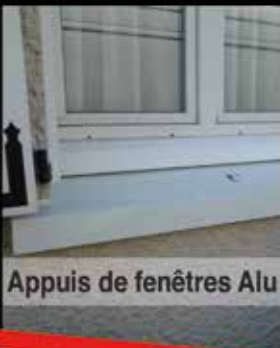
Appuis de fenêtres Alu

L'entreprise ALU GOUTTI vous propose depuis 12 ans toute une variété de produits en alu aussi bien adaptée aux maisons individuelles qu'aux bâtiments industriels et agricoles.