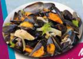
Moules de l'île Dumay