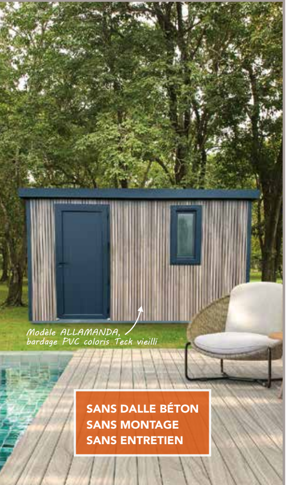
Modèle ALLAMANDA, bardage PVC coloris Teck vieilli

SANS DALLE BÉTON SANS MONTAGE SANS ENTRETIEN